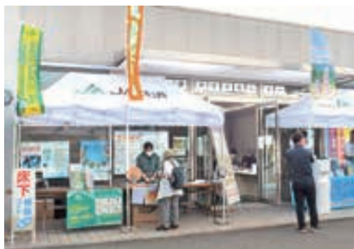
▲生活に関する各種相談コーナーを設けました

肥料や農業資材など特別価格での販売や商品券が当たるガラポン抽選会、キッチンカーの出店などで会場はにぎわいました。リフォームや白アリ無料診断など暮らしの相談コーナーを設け、多くのみなさまにご来場いただきました。