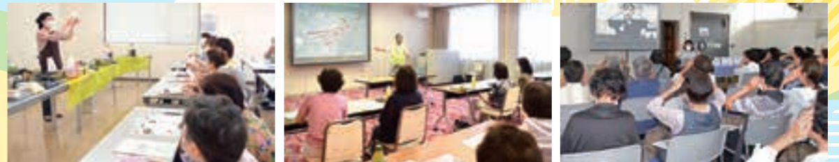
▲こめ油料理講習会