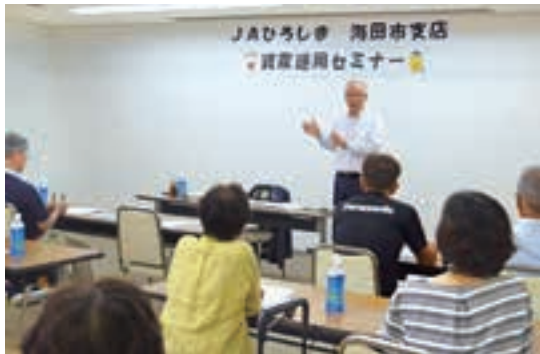
▲資産運用について初歩から分かりやすく学びました

J A海田市支店は8月21日、安芸郡海田町のJ A海田市支店会議室で「資産運用セミナー」を開催しました。組合員や地域住民など15人の方が参加されました。